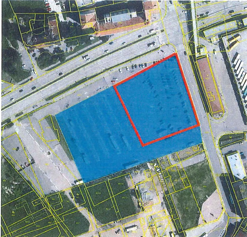
příloha č. 1 - Grafické znázornění umístění náhradních parkovacích stání