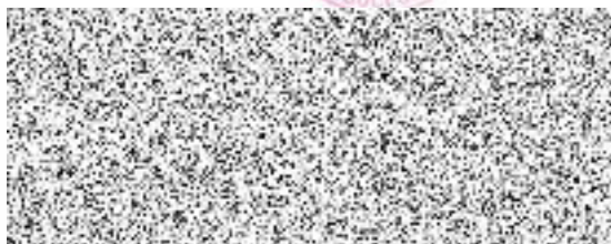
vedoucí Odboru školství Krajského úřadu Středočeského kraje

Střední škola, Základní škola a Mateřská škola da Vinci Na Drahách 20, 252 41 Dolní Břežany www.skoladavinci.cz, tel: 241 412 488 e-mail: info@skoladavinci.cz, IČ: 713 41 137